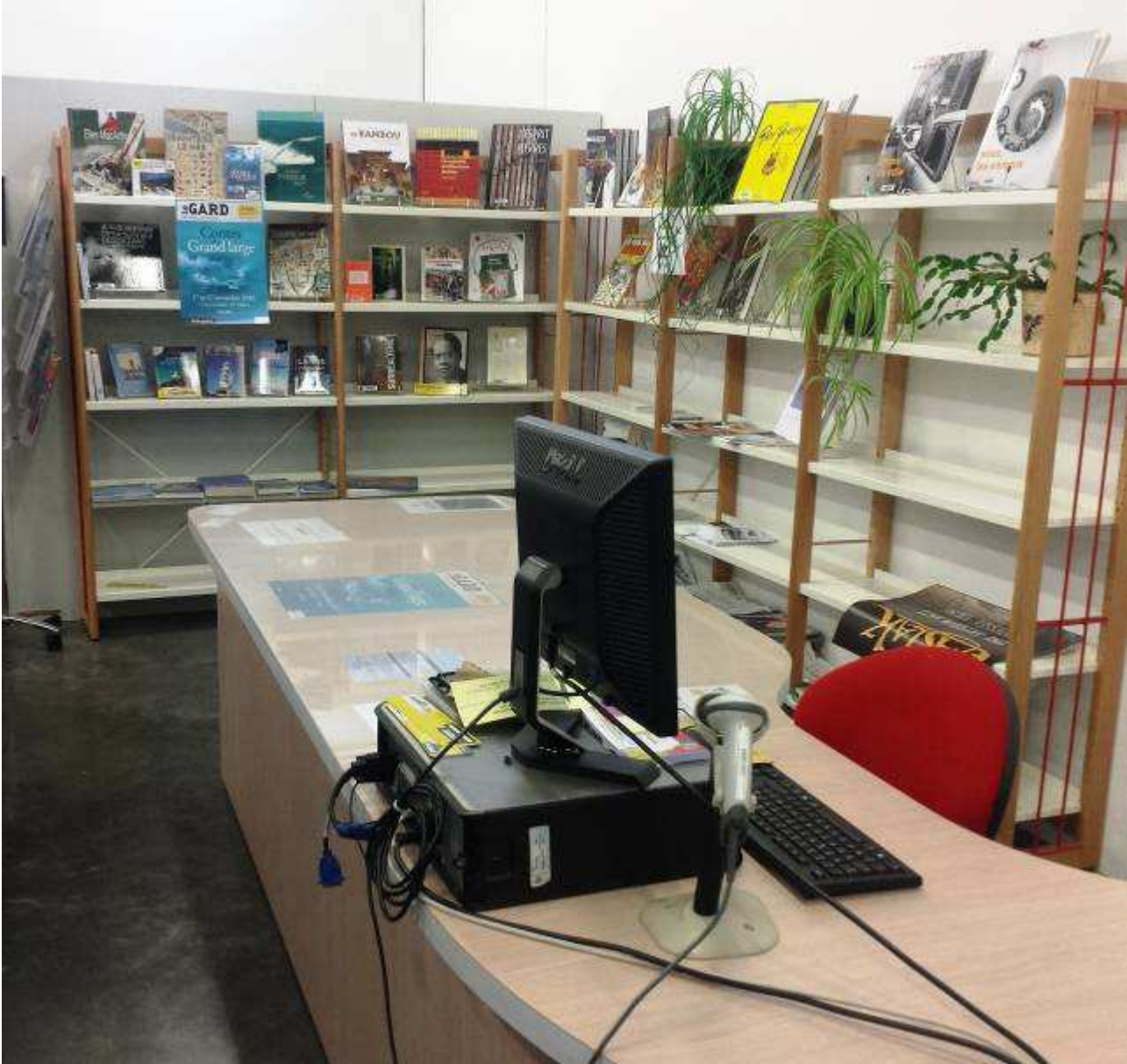
Nîmes – Accueil Magasin